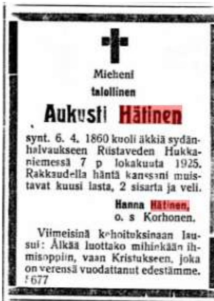
KUVA SEURAKUNNAN ARKIVILJELMÄSTÄ kuolinilmoitus Savon Sanomissa

Palon jälkeen pellot olivat varmaankin huonolla hoidolla joten karjan kasvatusta vaati lisää viljelysmaata ja entisen kunnostamista. Rahan saanti oli varmaankin tiukalla, kun myytävää oli vähän. Sen vuoksi säästäväisyys ja kädentaidot ratkaisivat elämän kehittymisen. Poikien varttuessa heistä oli apua peltojen kunnostuksessa ja uusien raivaamisessa. Varsinkin virran rannan alueella oli vielä kelvollista viljelysmaata puuston peittämänä. Siellä ukkinikin sai sydänkohtauksen ja kuoli 65 vuotiaana. Puhuttiin sydänhalvauksesta.