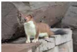
Kärppä

Kärppä on erinomainen kiipeilijä ja uimari. Se kulkee monenlaisissa ympäristöissä etsimässä myyriä. Jos myyrävuosi on huono, kelpaavat ravinnoksi myös liskot, sammakot, linnunmunat ja -poikaset, hyönteiset ja marjat. Kärppä on riistaeläin ja sen nahka on aikanaan ollut arvostettu turkis. Nykyään kärppän metsästys on vähäistä. Maailmanlaajuisesti kärppä luetaan sadan haitallisimman vieraslajin joukkoon. Sitä on aikanaan vietty mm. Uuteen-Seelantiin ja siellä se on tuhonnut alkuperäistä pieneläimistöä.