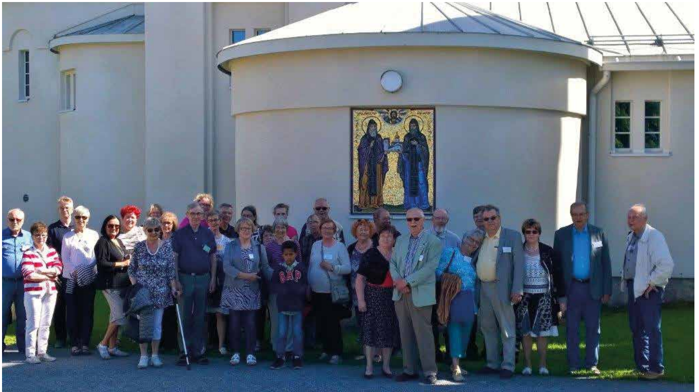
Retken osallistujia Valamon luostarin pääkirkon edessä.

Hätiset kokoontuivat 1.-2.7. seitsemänten sukukokoukseensa Tuusniemelle hotelli Hupeliin. Ensimmäisen päivän ohjelmassa lauantaina oli tutustuminen Valamon luostariin Heinävedellä. Kokous pidettiin sunnuntaina. Paikalla oli molempina päivinä noin 40 sukuseuran jäsentä seuralaisineen. Lämmin ja aurinkoinen sää suosi yhdessäoloa.